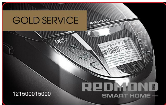
Лицевая сторона СК