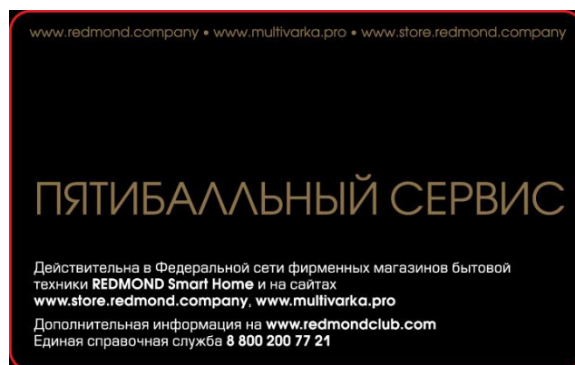
Оборотная сторона СК