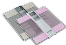
Весы напольные RS-719