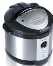
Мультиварка- сковорварка RMC-M4504