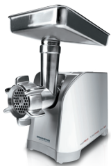
Мясорубка RMG-1203 RMG-1203-8