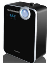
Увлажнитель воздуха RHF-3306