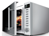
Микроволновая печь RM-M1006