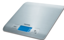
Весы кухонные RS-M720