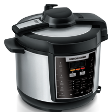
Мультиварка- скороварка RMC-M110