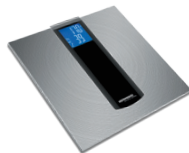
Весы напольные RS-723B