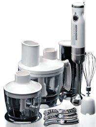
Кухонный комбайн RFP-3903