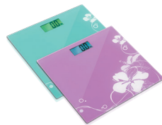
Весы напольные RS-707