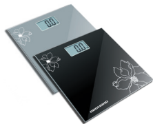
Весы напольные RS-708