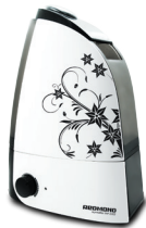
Увлажнитель воздуха RHF-3302