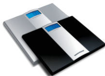
Весы напольные RS-710