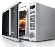
Микроволновая печь RM-M1007