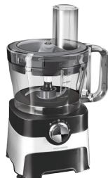
Кухонный комбайн RFP-3904