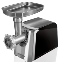
Мясорубка RMG-1205 RMG-1205-8