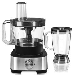
Кухонный комбайн RFP-3905