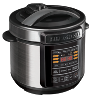
Мультиварка- сковорварка RMC-PM190