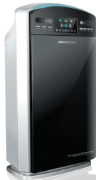
Очиститель воздуха RAC-3704