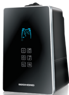
Увлажнитель воздуха RHF-3303