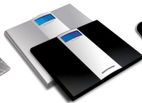
Весы напольные RS-710