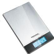
Весы кухонные RS-722