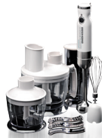
Кухонный комбайн RFP-3903