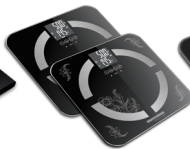
Весы напольные RS-713