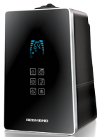
Увлажнитель воздуха RHF-3303