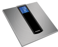
Весы напольные RS-723B