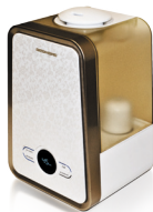
Увлажнитель воздуха RHF-3306