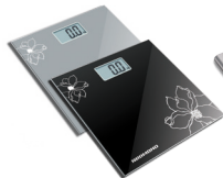
Весы напольные RS-708