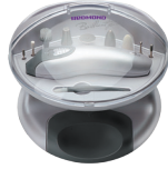
Маникюрный набор RNC-4901