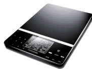
Весы кухонные RS-712