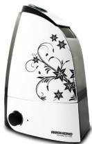
Увлажнитель воздуха RHF-3302