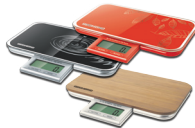
Весы кухонные RS-721