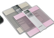
Весы напольные RS-719