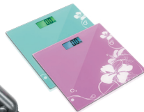
Весы напольные RS-707