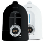
Увлажнитель воздуха RHF-3301