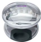
Маникюрный набор RNC-4901